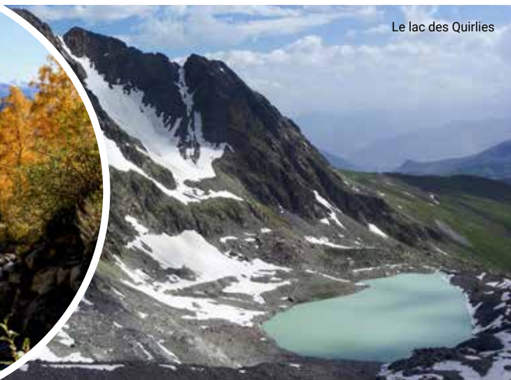
Le lac des Quirliès