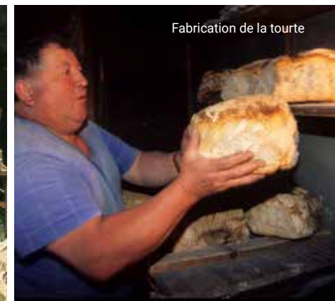
Fabrication de la tourte

Pour livrer l'essentiel du terroir Clavançon et de sa tradition culinaire typique de l'Oisans, interrogez les enfants du pays qui sauront vous parler des crozets, des farcis, des gratins d'herbes et autres recettes délicieuses !