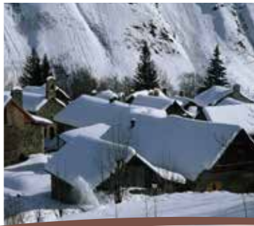
Montée au lac des Quirliès